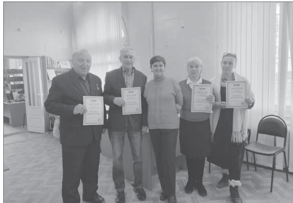
Очередной выпуск школы журналистики

Открою секрет. Вас мне послал Бог. Перед тем, как найти эти занятия, я молилась: «Господи, дай ещё одно любимое дело в моей жизни, чтобы нести добро!» Мозг требует работы. После трех дипломов, казалось, меня ничем