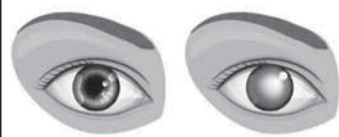
Здоровый глаз Катаракта

КАТАРАКТА – прогрессирующее патологическое состояние, связанное с помутнением хрусталика глаза. Единственный эффективный метод лечения – замена помутневшего хрусталика на искусственный.