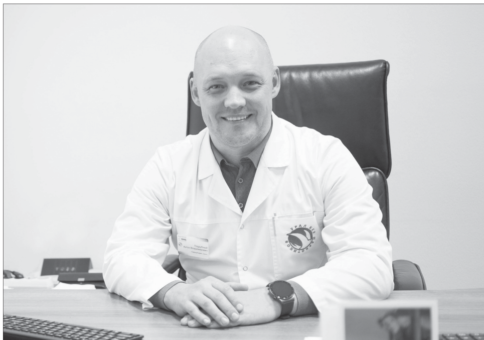
Антон Владимирович Поддубный, главный нарколог Уральского федерального округа

– Это сильнейшие токсические яды, которые тропны (чувствительны) для клеток головного мозга, отчего в первую очередь страдает психика. Наркомания – психическое расстройство, такое же, как и алкоголизм. Еще 10-15 лет назад мы столкнулись с так называемыми солями для ванн, которые до сих пор существуют. Они свободно продавались и не были внесены в перечень наркотических веществ. Но законодатели оперативно приняли меры, чтобы предотвратить распространение этих наркотиков. Огромной популярностью до сих пор пользуются клубные наркотики – синтетические психостимуляторы, которые употребляют в ночных увеселительных заведениях. Все чаще их стали употреблять люди молодого возраста для достижения состояния эйфории. Но это состояние длится недолго. Нет наркотиков, которые бы приносили постоянное удовлетворение от употребления. А развитие зависимости всегда происходит одинаково. Сначала увеличивается толерантность (восприятие) к веществу, потом она падает, человек уже не получает фи-