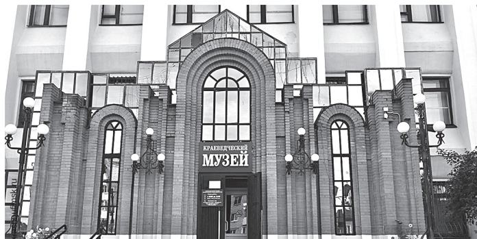
Красноуфимский краеведческий музей