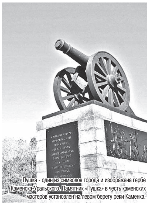
Пушка - один из символов города и изображена гербе Каменска-Уральского. Памятник «Пушка» в честь каменских мастеров установлен на левом берегу реки Каменка.

К осени 1701 года на левом берегу Каменки были возведены доменная печь, молотовая фабрика, амбары и другие сооружения. На правом берегу возвышалась крепость, была построена плотина. И 15 октября из Каменской домны был